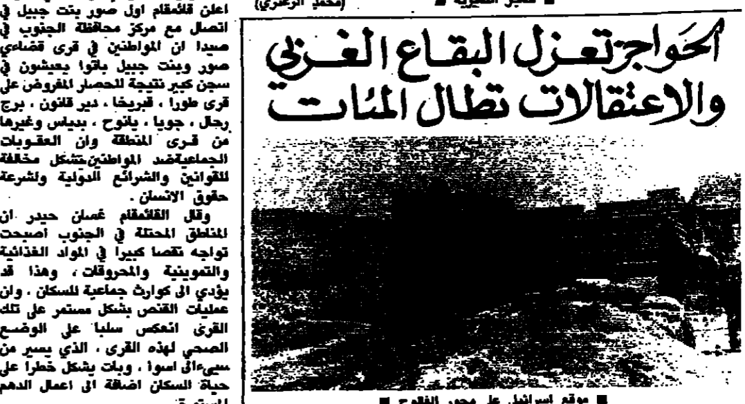
موقع اسرائيل على محور الفلوج

القوات الاسرائيلية تواصل اعمال التطويق والمقاومة تصعد هجماتها بمنطقة صور قائمقام صور يحذر من وضع مأساوي